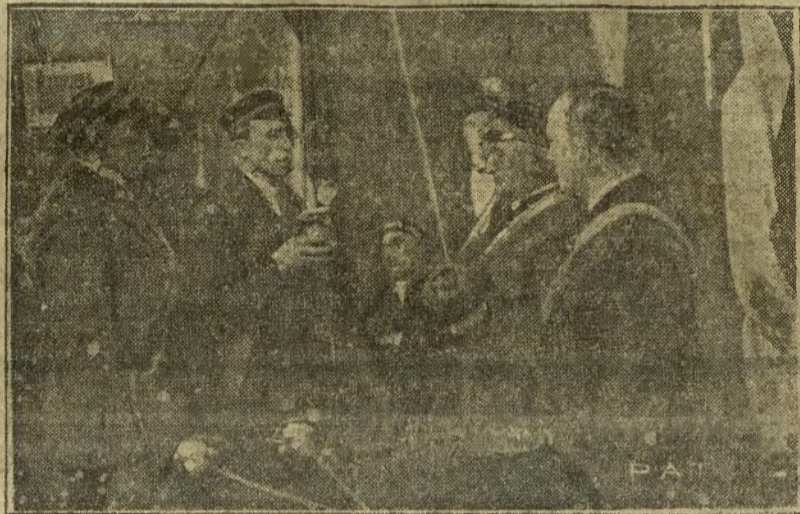
Przed kilkoma dniami prezydium akademickiej korporacji „Cresovia“ nadało J. E. ks. Biskupowi dr. Władysławowi Bandurskiemu godność filistra honoris causa. Zdjęcie: — ks. Biskup Bandurski jako filister na komerszu w Wilnie.