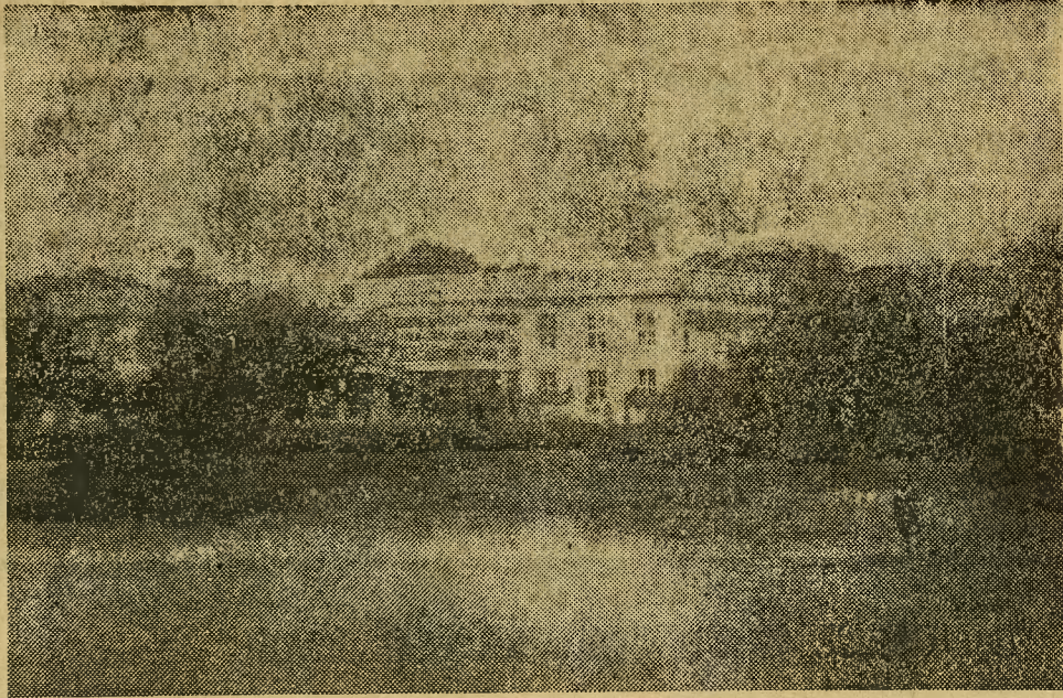
Zakład przyrodolecniczy od strony południowej.