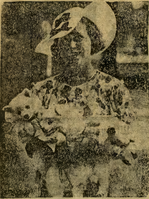
Pierwsza i druga nagroda na konkursie elegancji Pani z psem w Paryżu.