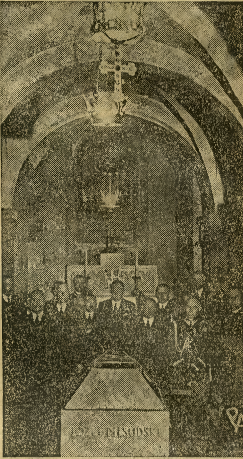
W krypcie św. Leonarda na Wawelu przed trumną Marszałka składają hołd Wielkiemu Wodzowi w ostatnim dniu Żałoby Narodowej przedstawiciele Rządu, Armji, ciał ustawodawczych i N. I. K. Na zdjęciu widzimy (od prawej do lewej): generalnego inspektora sił zbrojnych gen. Rydza-Smigłego, kierownika M. S. Wojsk gen. Kasprzyckiego, min. Kalińskiego, prezesa N. I. K. gen. Krzemińskiego, min. Becka, min. Zawadzkiego, min. Butkiewicza, marszałka Raczkiewicza, premiera Ślawka, min. Poniatowskiego, min. Paciorekowskiego i marszałka Światłowskiego.