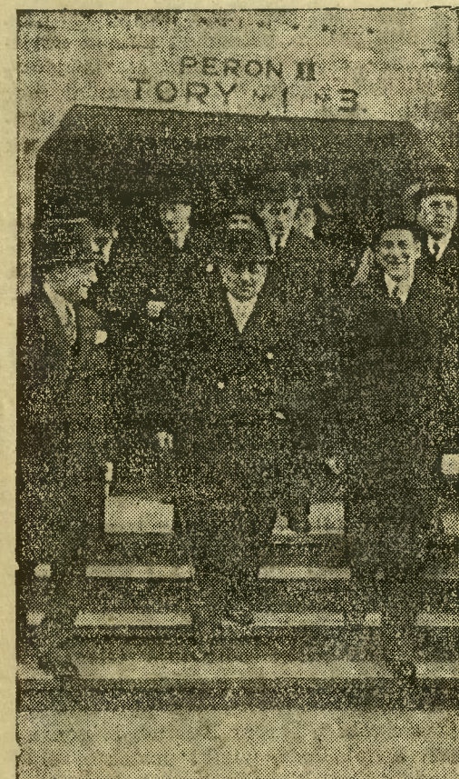
Francuski minister spraw zagranicznych, Pierre Laval opuszcza dworzec warszawski w dniu 9 bm. w towarzystwie ministra Becka, szefa protokołu dyplomatycznego hr. Romera i in.

Również w sobotę przed południem p. minister Laval przybył do Prezy-