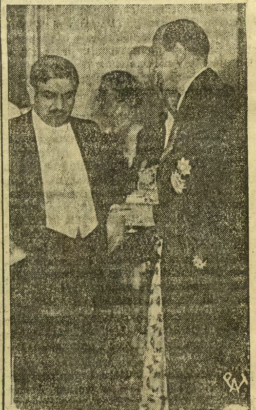
Dnia 10 bm. w salonach ministra Spraw Zagranicznych p. Józefa Becka odbył się raut, który zgromadził elitę polityczną, dyplomatyczną i towarzyską stolicy. P. minister Laval w ożywionej rozmowie z p. min. Beckiem

„Action Francaise” poddaje krytyce politykę francuską wobec Polski, stwierdzając, iż nie jest słuszne stanowisko niektórych publicystów francuskich, jakoby Polska wyłącznie ponosiła winę ochłodzenia stosunków francusko-polskich. Przez długi czas dyplomacja