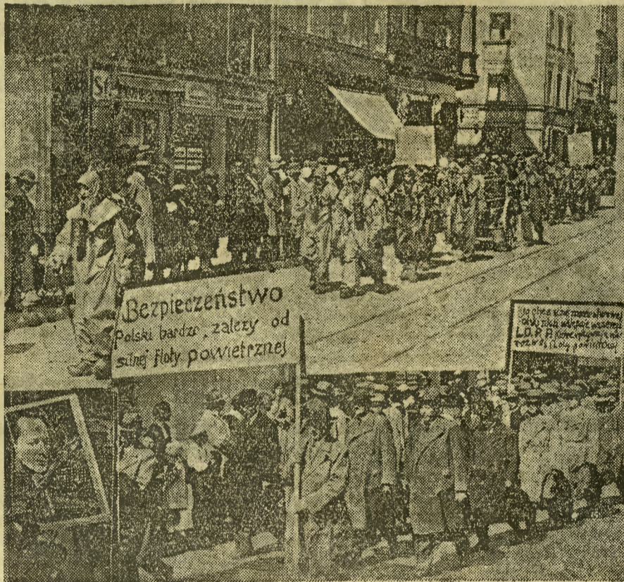
Drużyna ratunkowa przeciwgazowa (u góry) i organizacje cywilne (u dołu) w pochodzie propagandowym na ulicach Torunia. — Z lewej afisz propagandowy z wizerunkiem kpt. Bajana.

dymy dziś faktyczne narodziny Aeroklubu Pomorskiego, z drugiej zaś w dniu dzisiejszym rozpoczynamy na terenie naszego Okręgu L. O. P. P. sezon „Tygodnia LOPP” w ciągu którego zamierzamy potroić nasze wysiłki w kierunku dalszego popularyzowania naszych celów, zjednywania nowych członków i potęgowania ofiarności społeczeństwa na cele obrony przeciwlotniczej i przeciwgazowej naszego Państwa.