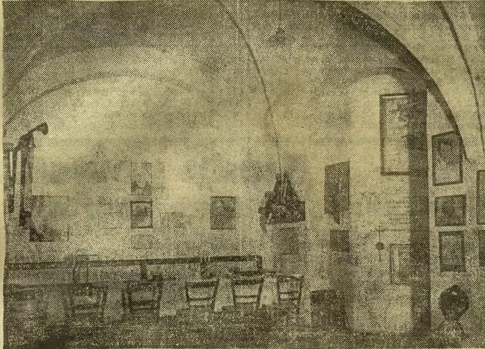
Wnętrze dawnej izby Konfraterni w parterze Ratusza od str. ul. Chełmińskiej.

Po położeniu podpisów w księżce pamiątkowej przez obecnych na uroczystości otwarcia przedstawicieli władz państwowych i komunalnych oraz gości majster Gros odczytał szereg gratulacyjnych depech, z których zdążyliśmy zanotować następujące: