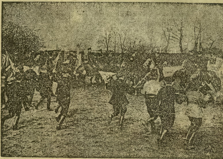
Ćwiczenia angielskiej policji konnej. Próba, przedstawiona na zdjęciu, ma na celu opamiętanie strachu koni policyjnych, które są specjalnie płoszone.