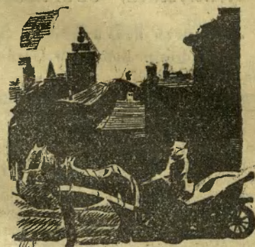
Wędrowka mikrofonu po Wilnie w poniedziałek dn. 25.III. o godz. 18.