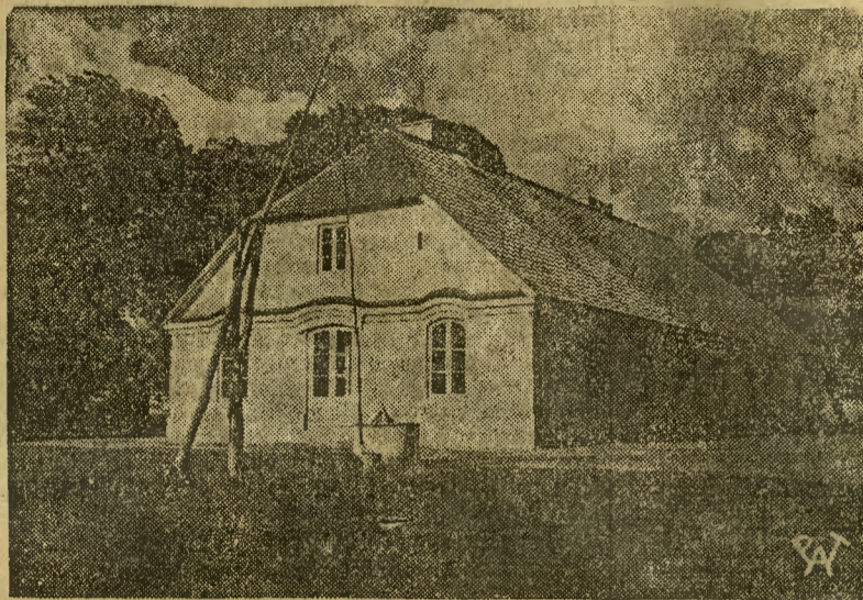
Odbudowana oficyna dworu Skarbków w Żelaznej Woli pow. Sochaczewskiego, gdzie 22 lutego 1810 r. urodził się Fryderyk Chopin.