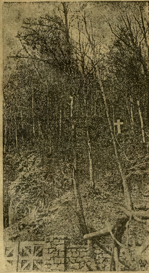
Krzyż ustawiony w miejscu, w którym rok temu zginął tragicznie król Belgów Albert I.