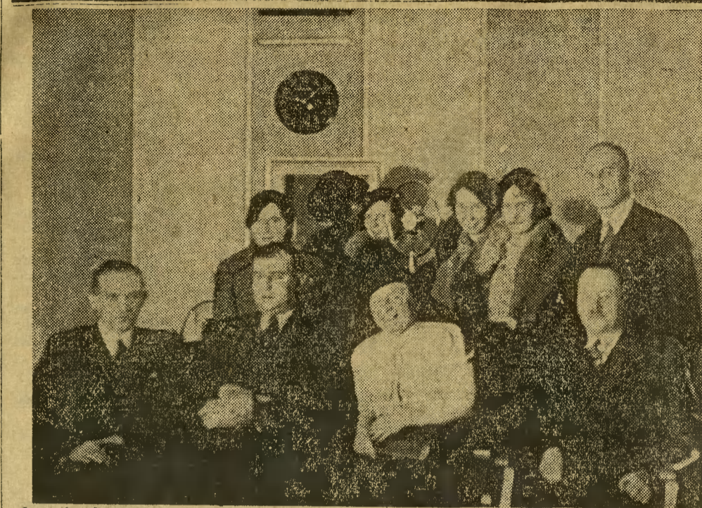
Jury konkursu na speakerkę oraz 5 kandydatek, które przeszły przez drugie „sito“.