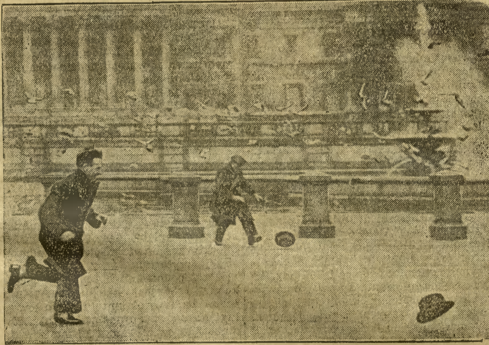
Huragan niedzielny, który dał się we znaki mieszkańcom Torunia, nawiedził nie tylko całą Polskę, ale i niemal całą Europę. Klisza wyobraża jedną z ulic w Londynie z latającymi kapeluszami i fruującymi, jak gołębie gzymsami.