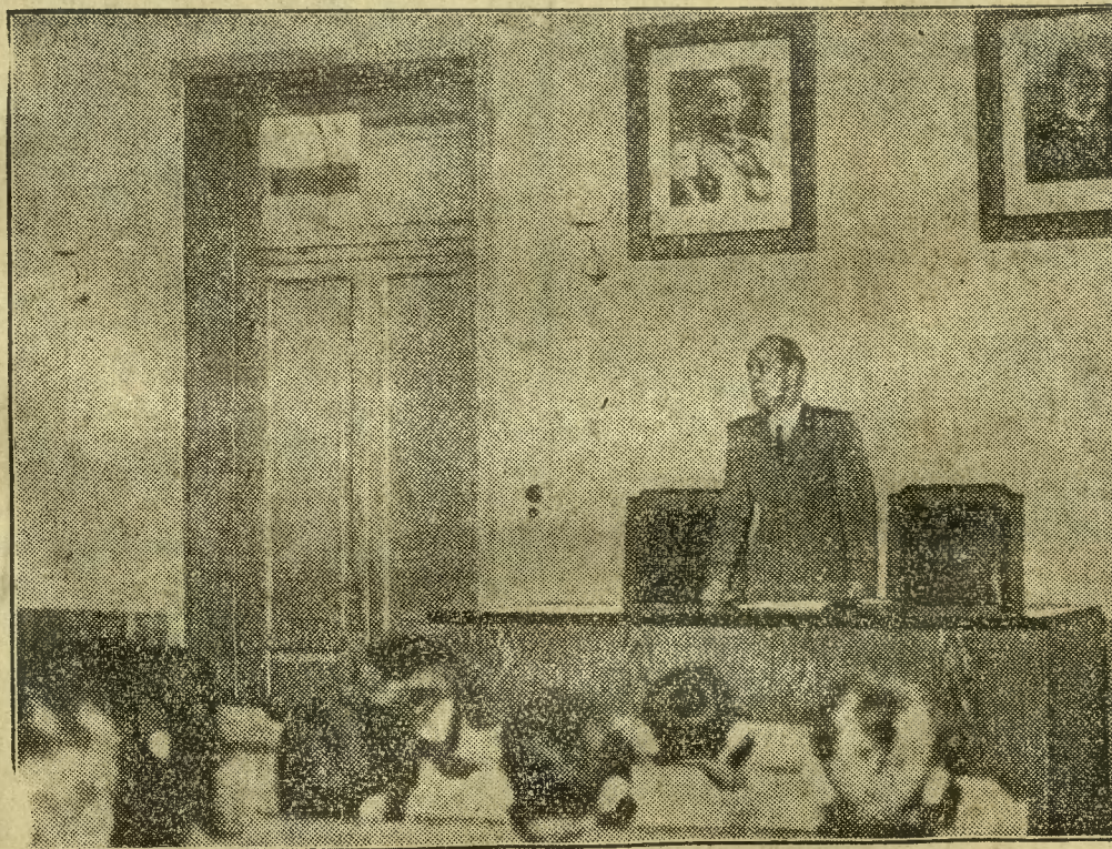
„Il Duce” zarządził wprowadzenie do programów szkolnych nowego przedmiotu „sprawy wojskowe”, którego wykładowcami są oficerowie.