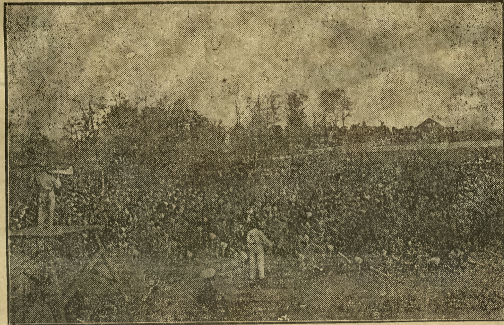
Coraz bardziej rozwijające się życie sportowe ogarnia najdalej nawet zakątki naszego kraju, znajdując tysiące zwolenników zwłaszcza wśród młodzieży. — Na zdjęciu naszym widzimy ćwiczenia gimnastyczne młodzieży szkolnej na otwartym boisku w Łukowie.