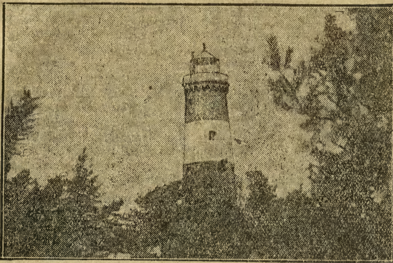
Do największych latarni morskich na południowym wybrzeżu Bałtyku należy latarnia, w osadzie Hel, na półwyspie helskim, którą widzimy na naszej ilustracji.