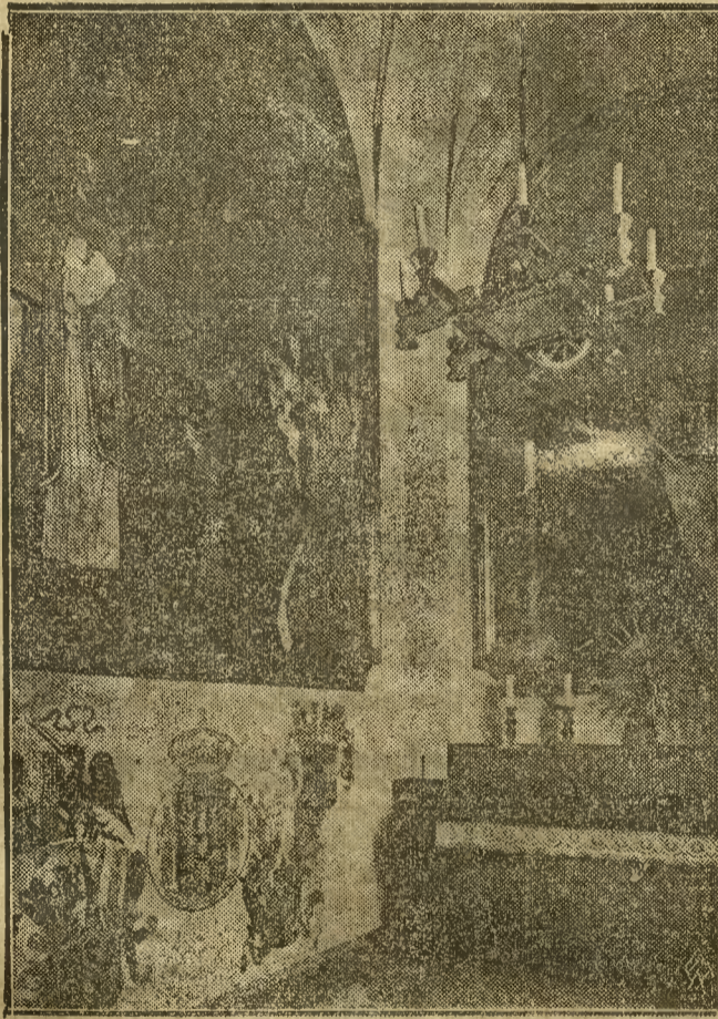
W związku z przypadającą na r. b. 250-tą rocznicą ocalenia Wiednia przez króla Jana Sobieskiego, podajemy na naszym zdjęciu widok wnętrza kaplicy Jana Sobieskiego na górze Kahlenberg pod Wiedniem z godłami i obrazami króla Jana III Sobieskiego.