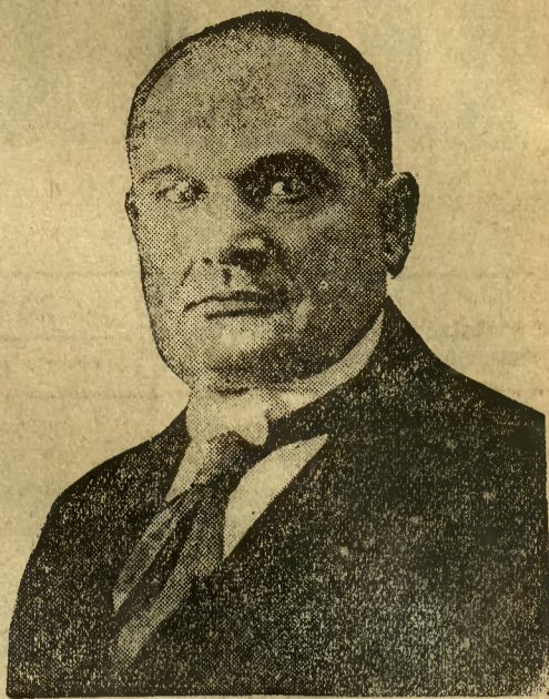
W związku z ustąpieniem dwóch ministrów z centrum, gabinet p. Paetsa podał się do dymisji. Na zdjęciu naszym podajemy podobiznę b. premiera, a równocześnie naczelnika republiki Estońskiej p. K. Paetsa.