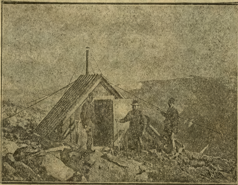
Na zdjęciu naszym widzimy schronisko turystyczne wybudowane na szczycie Kebnekaise, najwyższej góry Szwecji, na wysokości 6400 stóp. Schronisko to zapewnia zmęczonym turystom wygodny odpoczynek po trudach uciążliwej wycieczki.