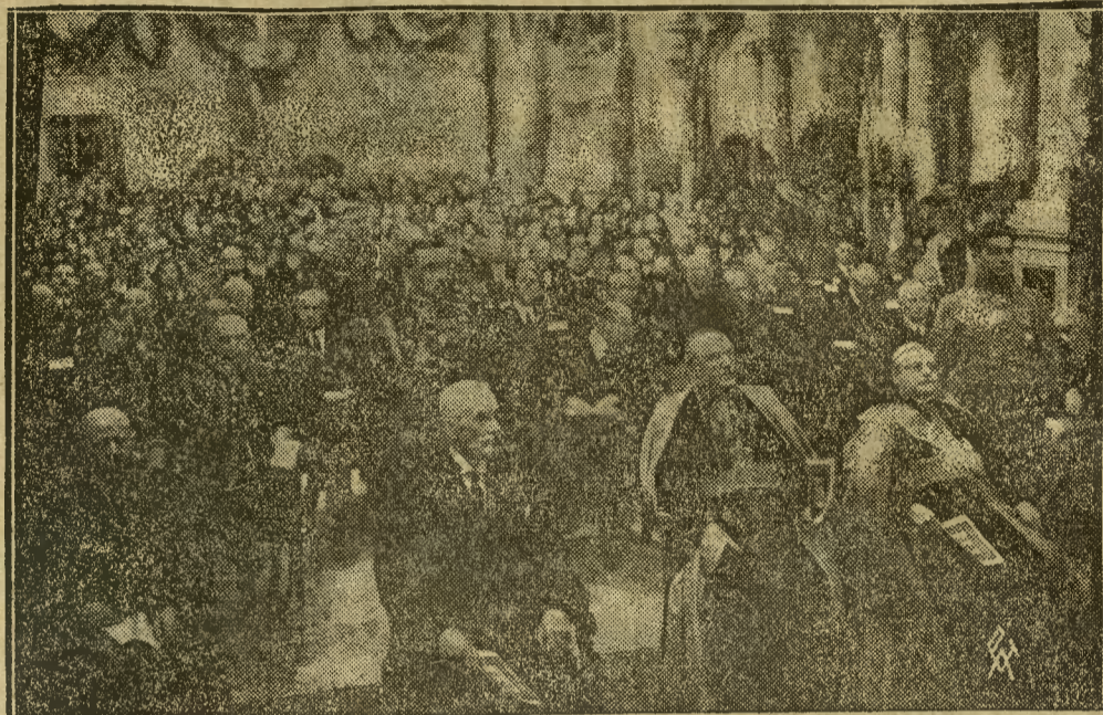
W sali Rady Miejskiej w Warszawie odbyła się akademja celem uczczenia 11 rocznicy koronacji i pontyfikatu Jego Świętobliwości Piusa XI Na zdjęciu naszym widzimy uczestników akademji. W pierwszym rzędzie siedzą od strony lewej: p. prezes Rady Ministrów A. Prystor P. Prezydent Rzplitej prof. I. Mościcki, kardynał ks. Kakowski, nuncjusz ks. Marmaggi.