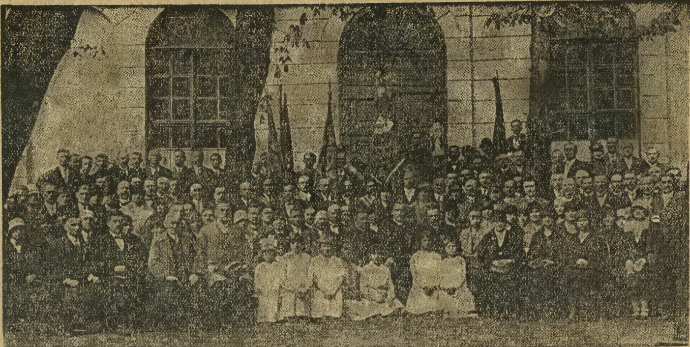
Uczestnicy niedzielnej uroczystości poświęcenia sztandaru Tow. Robotników Kat. przy parafii św. Trójcy.