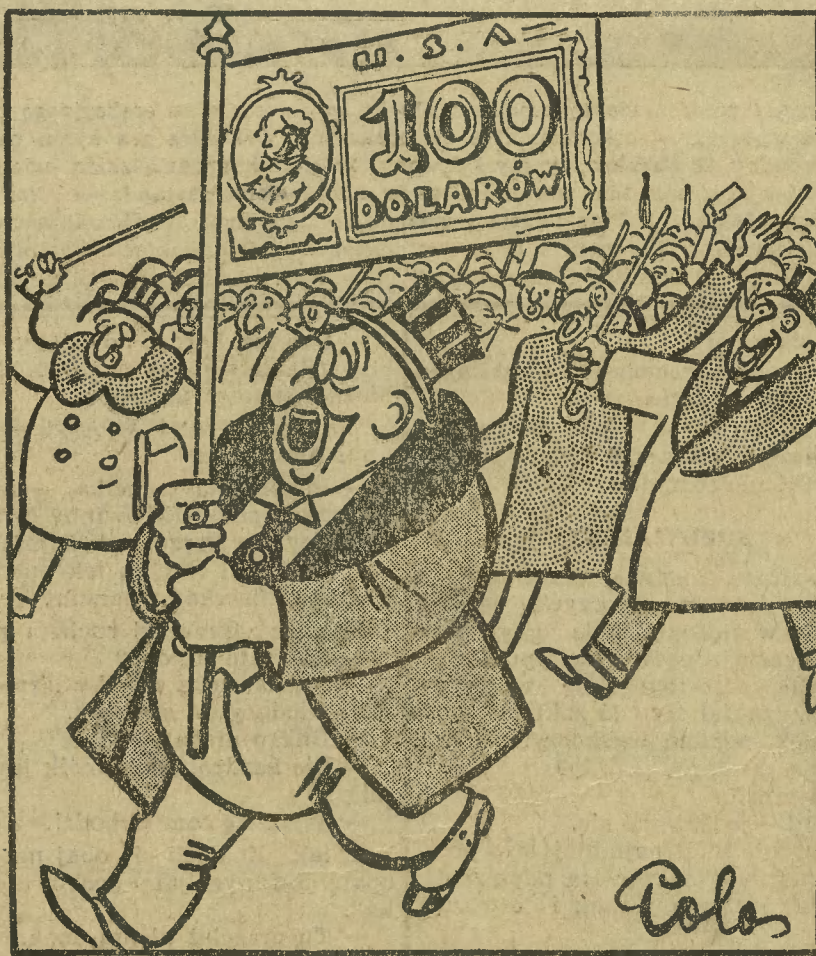
dziś tak maszeruje przeciw wrogom kościoła kapitał międzynarodowy.