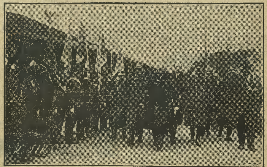
Prezydent wśród Braci Kurkowych.