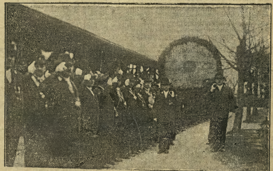
Historyczna tarcza Bractwa Kurkowego, do której strzelali królowie polscy i obecny Prezydent Rzeczypospolitej.