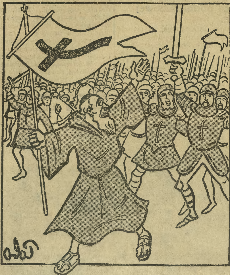
Tak Piotr z Amiens prowadził wiernych przeciw niewiernym,