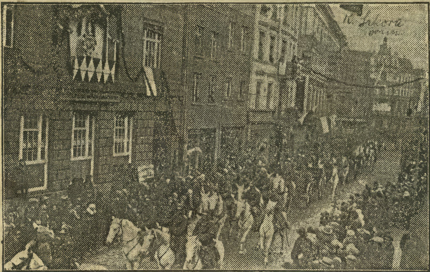
Ogólny widok defilady.