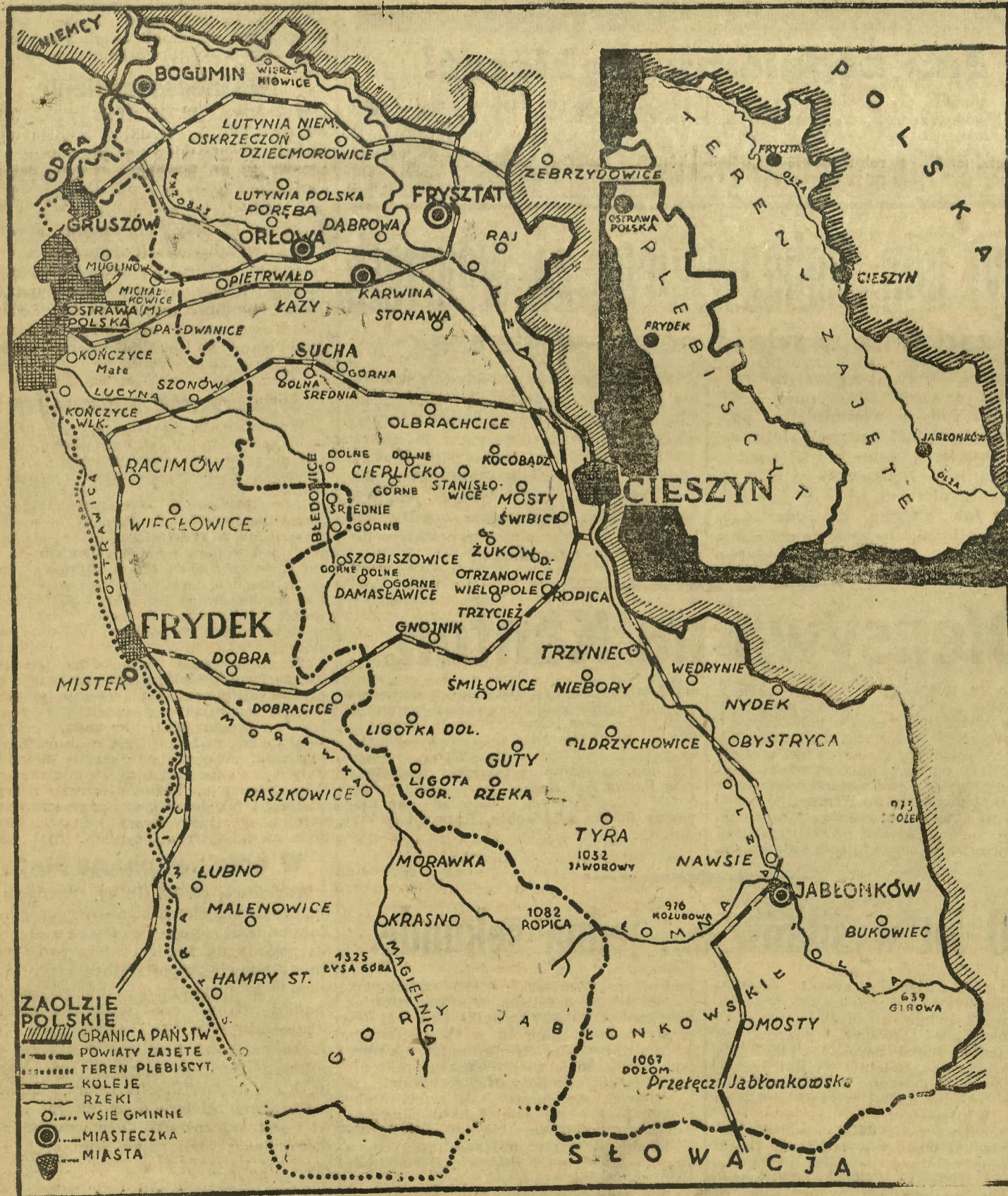
o który zwiększyły się granice Polski. Linia kropkowaną zaznaczona jest granica powiatu frydeckiego, którego losy, jak również i losy Spisza, Orawy i ziemi Czadeckiej, m uszają się w najbliższym czasie rozstrzygnąć.