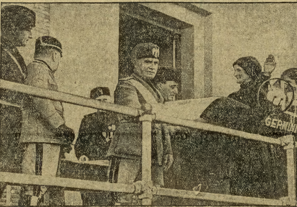
Na dawnych bagnach pontyńskich dziś wysuszonych powstała nowa 93-cia prowincja włoska. Mussolini z okazji proklamacji nowej prowincji Littoria rozdaje dzielnym robotnikom dyplomy honorowe.