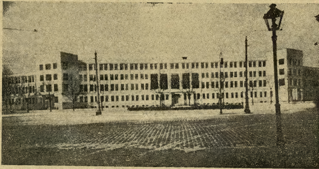
Gmach, początkowo przeznaczony na siedzibę urzędu wojewódzkiego, zbudowano według projektu arch. Polkowskiego.