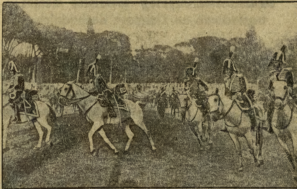
W obecności Mussoliniego odbyły się popisy kawalerji włoskiej w historycznych uniformach ówczesnych samodzielnich państw włoskich. — U góry karabinierzy królewscy galopują w uniformach z przed 100 lat.