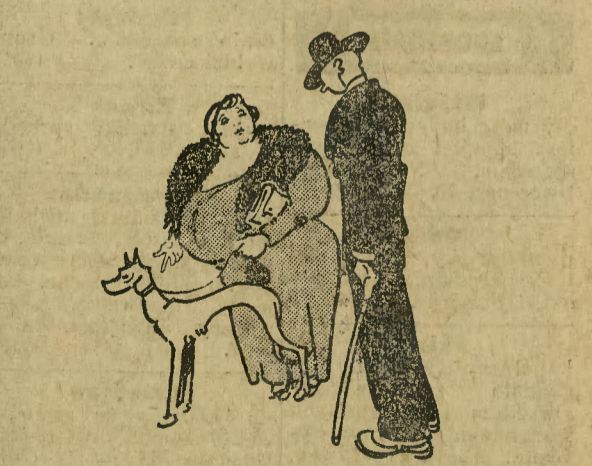
— Wie pan, muszę z „Luxem“ codziennie wychodzić na przechadzkę, żeby miał ruch, inaczej zanadto tyje.

Ceny ogłoszeń: 25 gr. za wiersz milimetrowy na stronie 7-lamowej szerokości 38 mm. Za reklamy na stronie przed ogłoszeniami 70 gr., w tekście na drugiej i trzeciej stronie 1,20 zł. na dalszych stronach 1,00 zł. za milim. 1 lam., szer. 67 mm. Drobne ogłoszenia słowo tytułowe 25 gr., każde dalsze 15 gr.; dla poszukujących pracy oraz na nekrologi 20% zniżki. Większe ogłoszenia, zamieszczone wśród drobnych, 50% drożej jak w zwykłym dziale ogłoszeniowym. Przy powtórzeniu ogłoszeń o tym samym tekście udziela się rabatu. Przy konkursach i dochodzeniach sądowych wszelkie rabaty upadają. — Ogłoszenia zagraniczne 25% dopłaty. — Ogłoszenia skomplikowane oraz z zastrzeżeniem miejsca o 20% drożej. Za terminowe umieszczenie i przepisane miejsce administracja nie odpowiada. — Miejsce płatności: Bydgoszcz. — Konta bankowe: Bank Związku Spółek Zarobkowych, Bank Ludowy, Konto czekowe: P. K. O. 203713 Poznań.