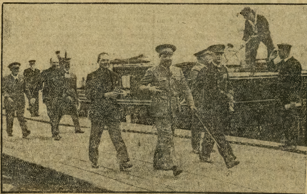
Włoski minister lotnictwa Balbo, dowódca ekspedycji lotniczej, udal się po wylądowaniu w Amsterdamie na ląd.