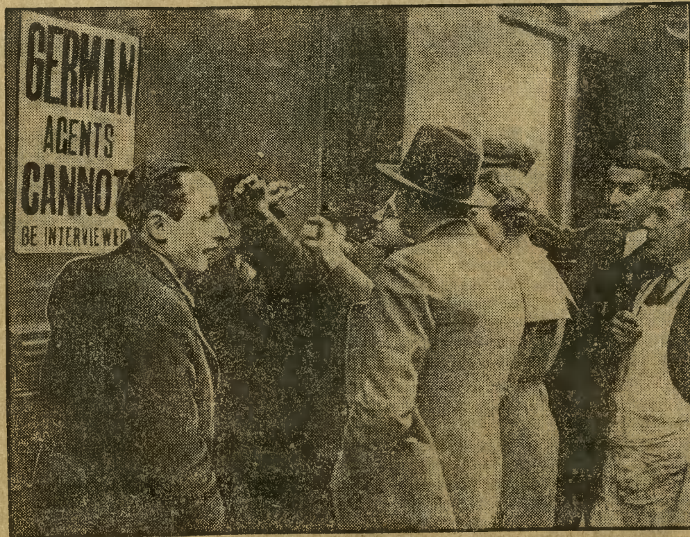
Na drzwiach wielu sklepów żydowskich w Londynie przytwierdzono plakaty wypraszające przedstawicieli niemieckich fabryk i hurtowni.