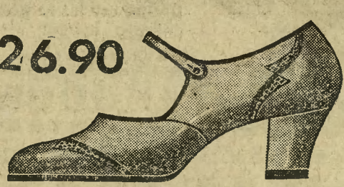
Fason 1645-20 Wytwornie ozdobiony boksowy pantofelek na pół-wysokim obcasie.

Polecamy nasz obfity wybór pończoszek we wszelkich modnych kolorach i odcieniach, które gustownie uzupełnią obuwie Pani.