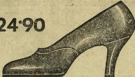
Fason 9905-03 Eleganckie zamszowe czółenka czarne lub brązowe na wysokim obcasie.