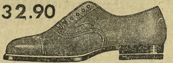
Fason 9837-21 Eleganckie półbuty lakierowane, które zdobyły wielkie powodzenie