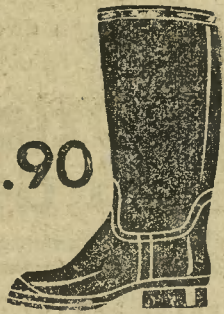
Dla dzieci. Fason 9891-50 Wellingtonki z lakierowanej gumy w kolorze czarnym lub brązowym.