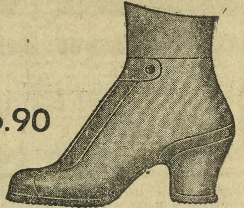
Fason 1885-05 Całogumowe czarne śniegowce na paseczku, z gustownym kołnierzykiem gumowym.

W rejestrze handlowym A. str. 70 wpisano dziś przy firmie Andrzej Turz w Więcborku, że udzielone firmie odroczenie wypłat uchylono uchwałą sądowną z dnia 27 listopada 1931 r. (26868)