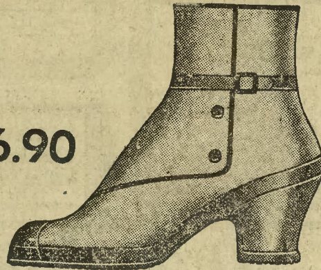
Fason 1875-98 Całogumowe śniegowce, gustownie ozdobione. Zapinane na zatrzask.