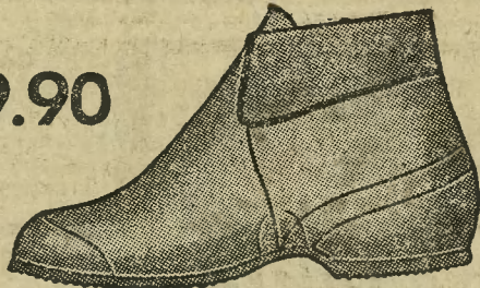
Fason 2862-01 Ciepłe całogumowe śniegowce dziecięce, obramowane aksamitem.