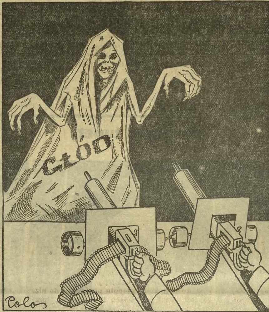
Tem nie wypłoszy głodu.