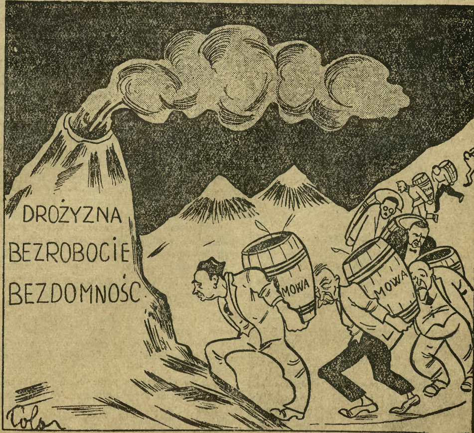
Czy ministrowie taką wodą ten wulkan zaleją?