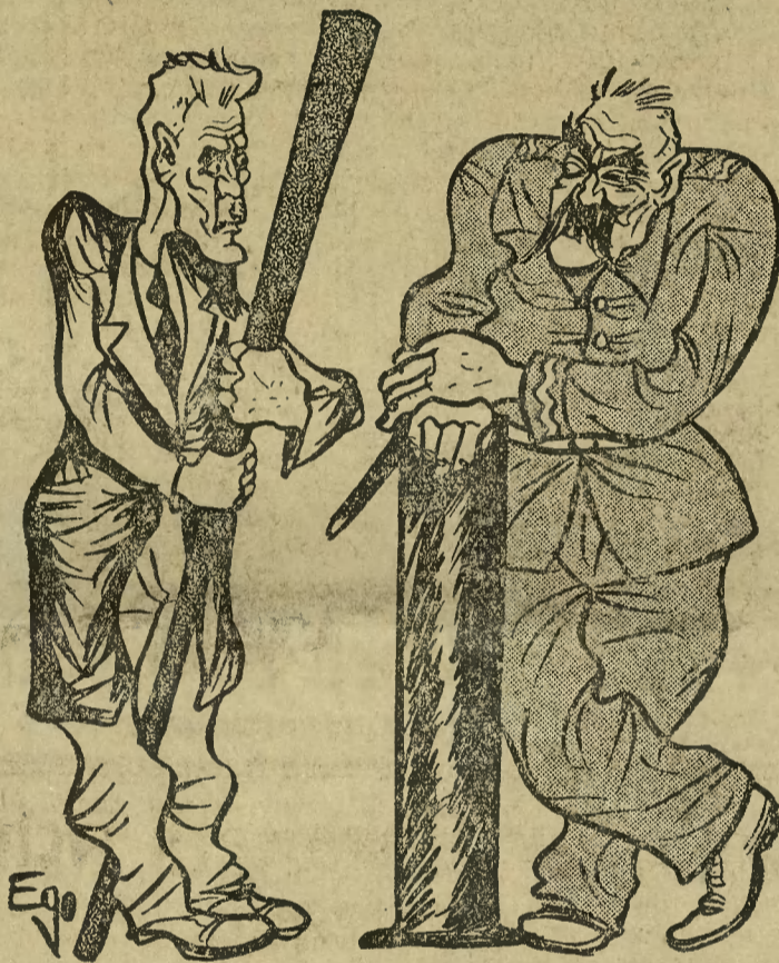
Która pała marszałkowska będzie mocniejsza.