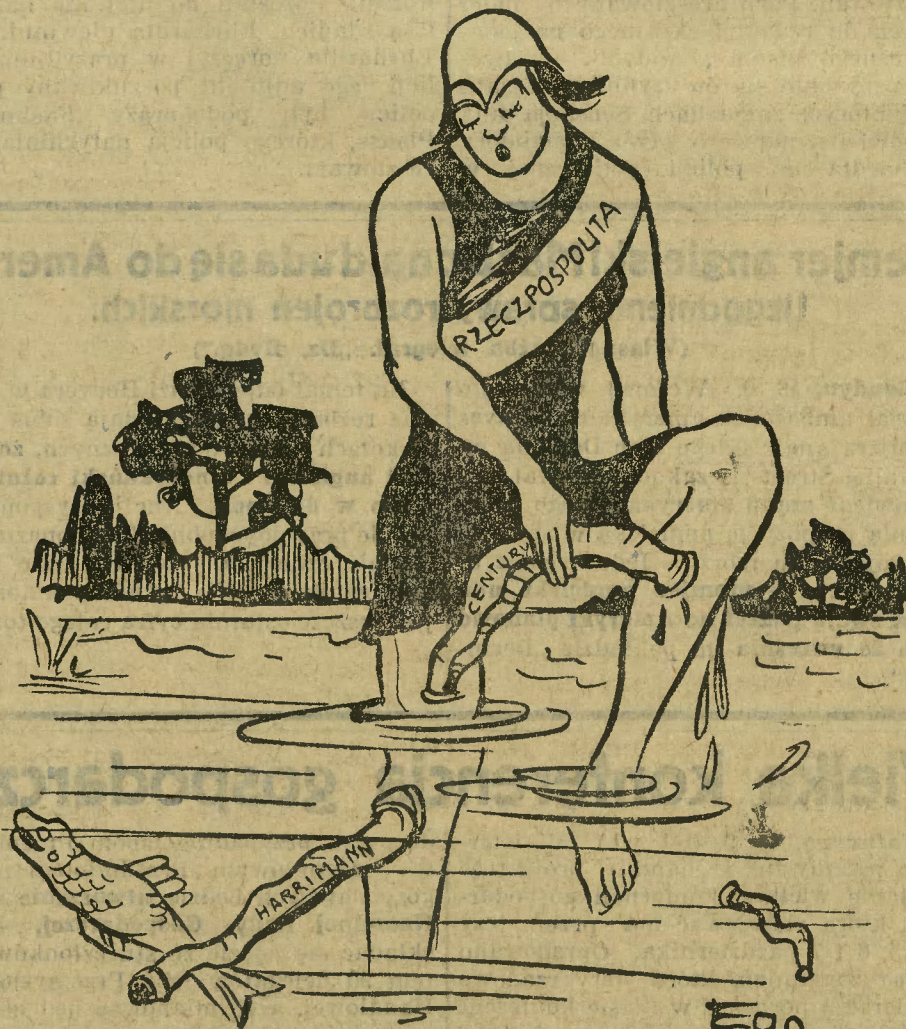
Ledwo jedną oderwałam, już druga się przyczepiła.