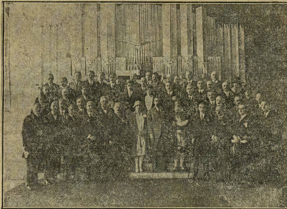
Wycieczka parlamentarzystów francuskich na P. W. K.

Nie wskazana też jest całkowita łączność na polu myśli teoretycznej, czy działalności społecznej lub politycznej. Nie wskazana, ani nawet nie do prze-