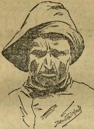
Rybak z Helu.

Mieszkańcy osady rybackiej i pięknego miejsca kąpielowego, położonego na południowo-wschodnim krańcu półwyspu, wysłali delegację do Prezydium Rady Ministrów w Warszawie z prośbą o przywrócenie im praw miejskich.