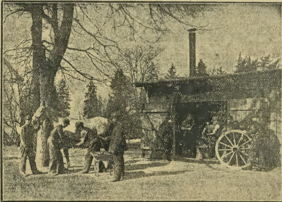
Wychowankowie uczą się kowlstwa.