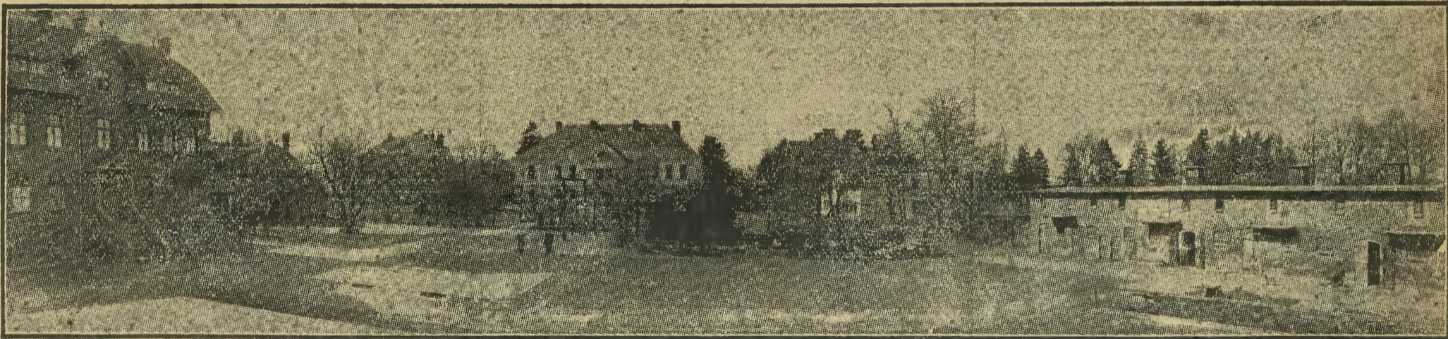
Widok ogólny zakładu i zabudowań gospodarczych.