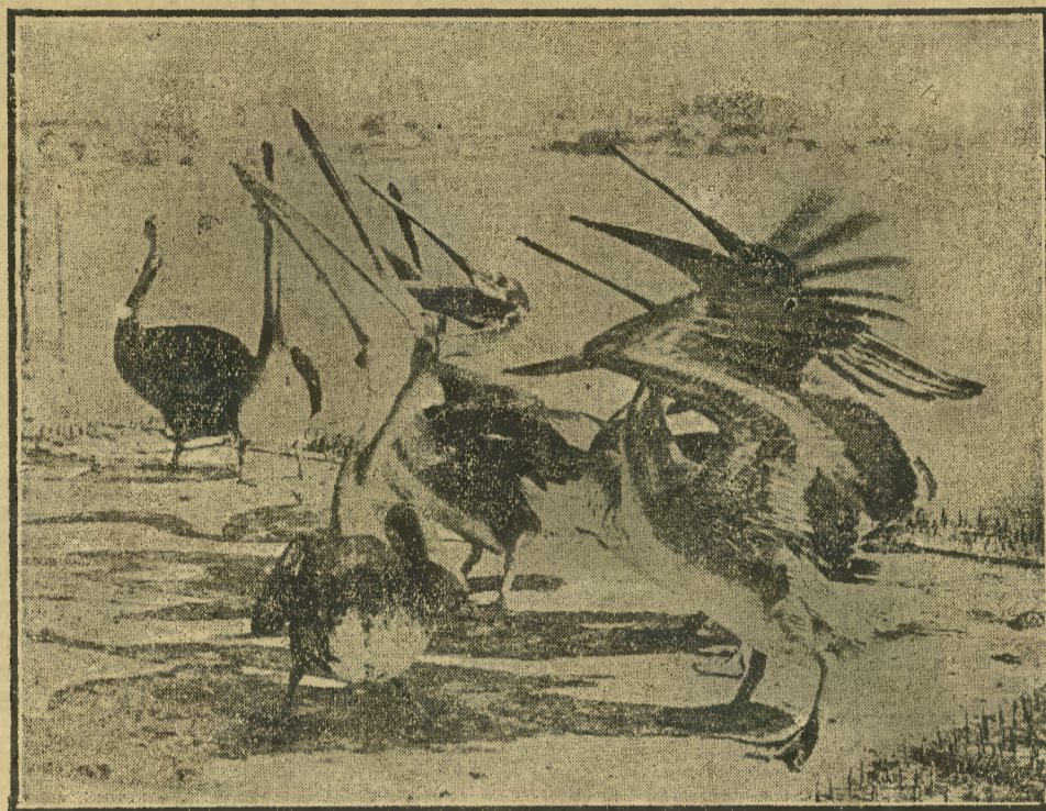
Pelikany połykające ryby na wybrzeżu kalifornijskiem.

ków przeciwko skarbowi, czy też tkwi tu niemożność ponoszenia tych ciężarów? Biorąc pod uwagę nadwyżkę sum, które skarż otrzymał tytułem podatku obrotowego, w porównaniu z preliminarzem, trudno chyba przypuszczać, że sfery przemysłowo-handlowe uchylają się od płacenia podatków. A zatem suma ta jest najwymowniejszym dowodem, że ciężary podatkowe ponoszone przez miasta są zbyt wielkie.