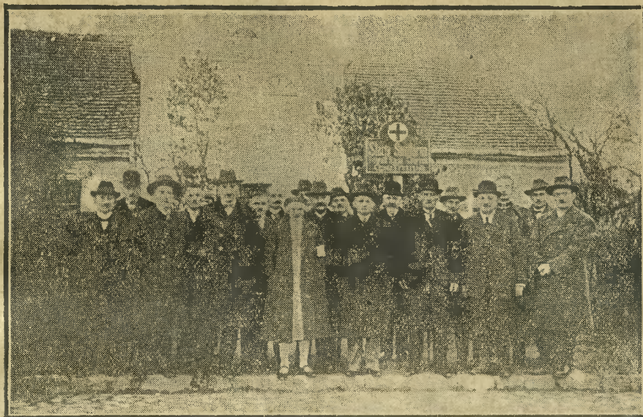
Uczestnicy poświęcenia stacji sanitarnej, które odbyło się w ub. dniach.

MROCUA. Jarmark na konie, bydło, kram i gwiazdkowy odbędzie się w Mroczy we wtorek dnia 18. bm.