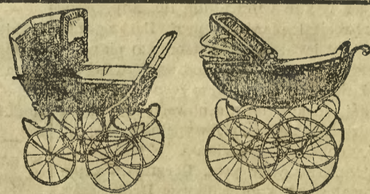
Wózki dziecięce 24047

Przyjazd: z Bydgoszczy 9 30 do Szaradowa Zal. 10 19 Odjazd: z Szaradowa Zal. 15 38 do Bydgoszczy 19 36 . (24937)