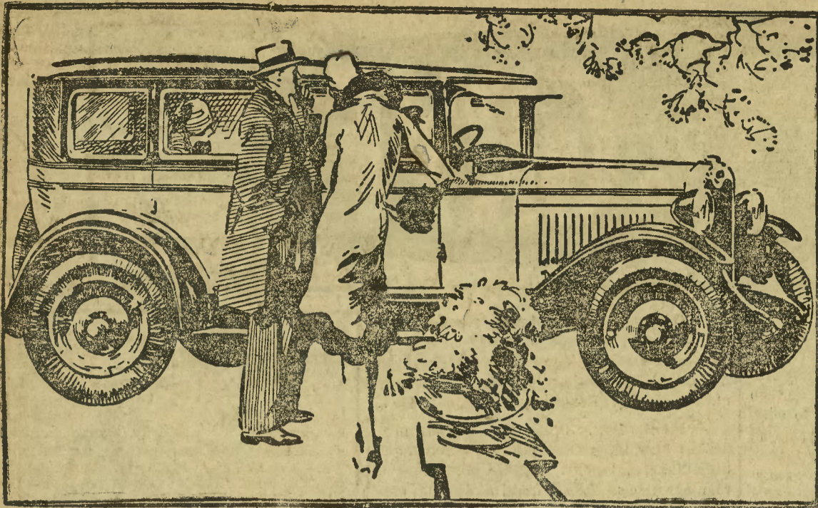
Każdy samochód Chevrolet zaopatrzony jest w jednoroczną gwarancję