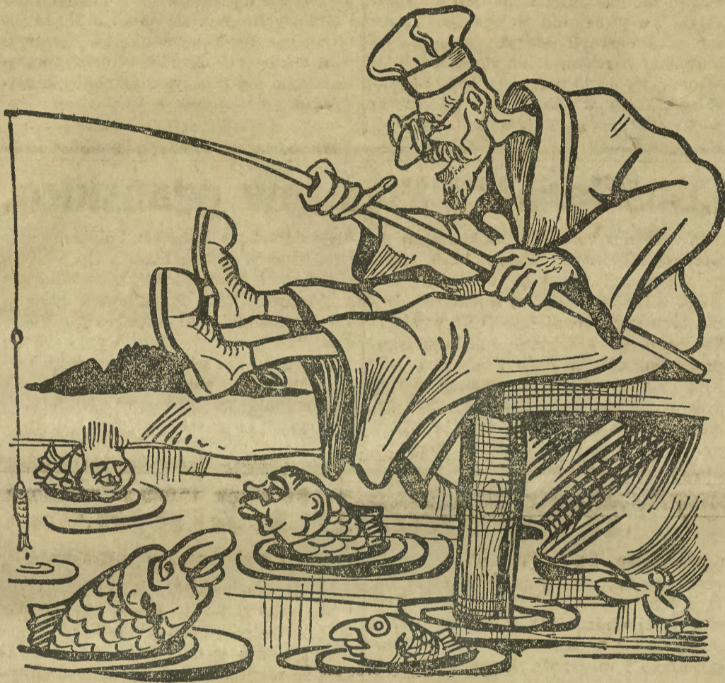
Pan prokurator łowi kryminalne ryby.