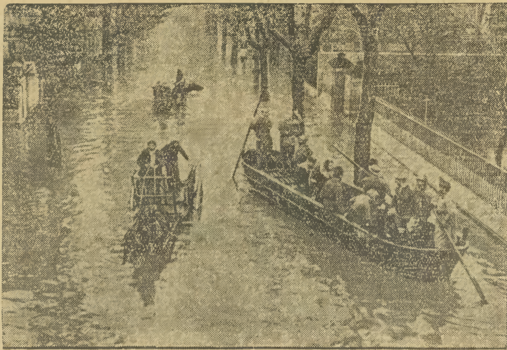
Znane w historii jako stolica papieża miasto Avignon w Południowej Francji uległo wraz z okolicą katastrofalnej powodzi. Ulice miasta znajdują się pod wodą — ruch odbywa się przy pomocy łodzi i pontonów wojskowych.