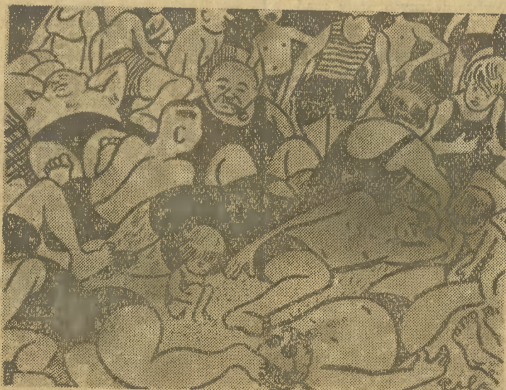
NA DZIKIEJ PŁAŻY.

A ponieważ w mieście Bydgoszczy czasów polskich dotąd urzędowo nigdzie nie ogłoszono, które miejsca są przeznaczone dla kąpiel, nie można więc ludzi