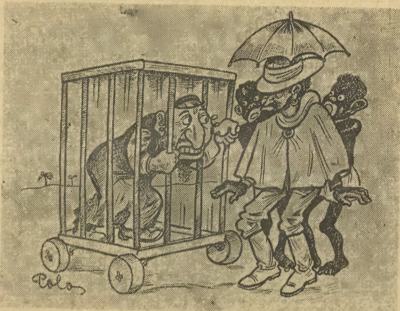
Król królów Abisynji przysłał w prezencie P. Prezydentowi Rzplitej pięknego lwa. Wzamian należałoby mu posłać okaz w Polsce najpospolitszy, a w Abisynji może nieznanym...

Zadna interwencja wojskowa nic tu nie pomoże; polityka Anglii względem Japonii musi być oparta na podstawie gospodarczej i na potrzebach gospodarczych obydwóch państw.