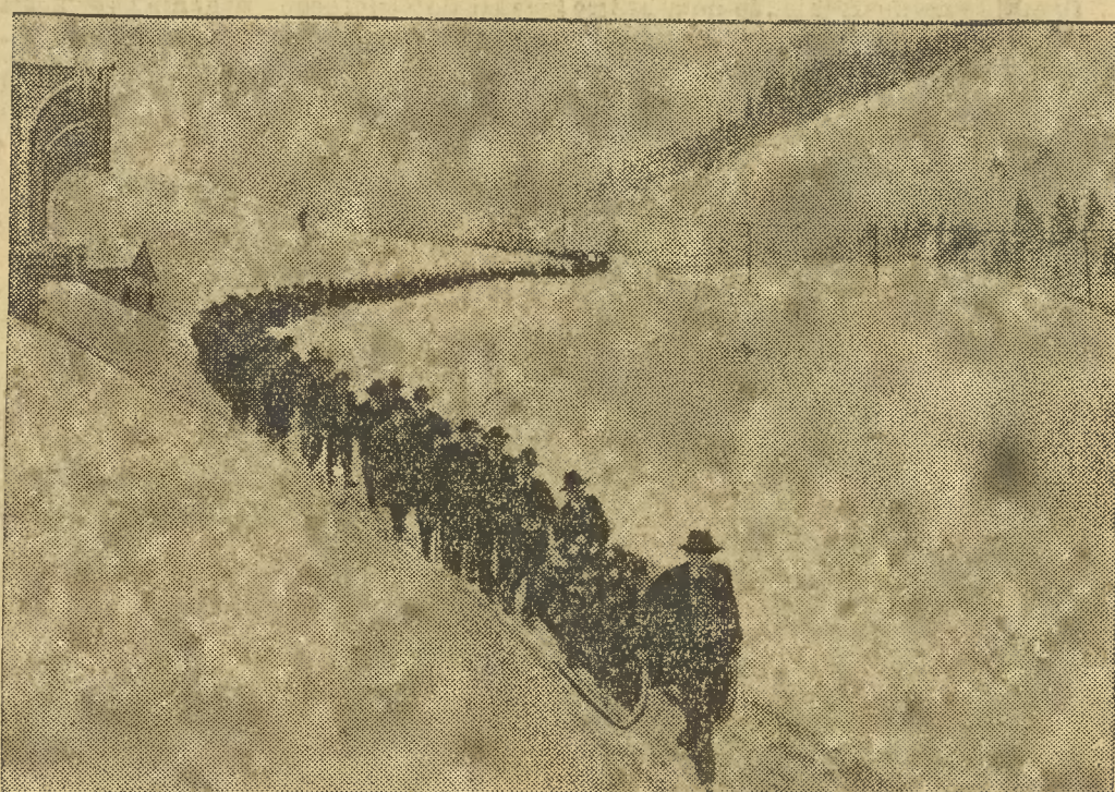
Siedem ofiar w zabitych pociągnęła za sobą lawina w St Antonien w Alpach szwajcarskich. Przyjaciela przewieźli na saniach trumny ze zwłokami zabitych do odległej kaplicy cmentarnej.