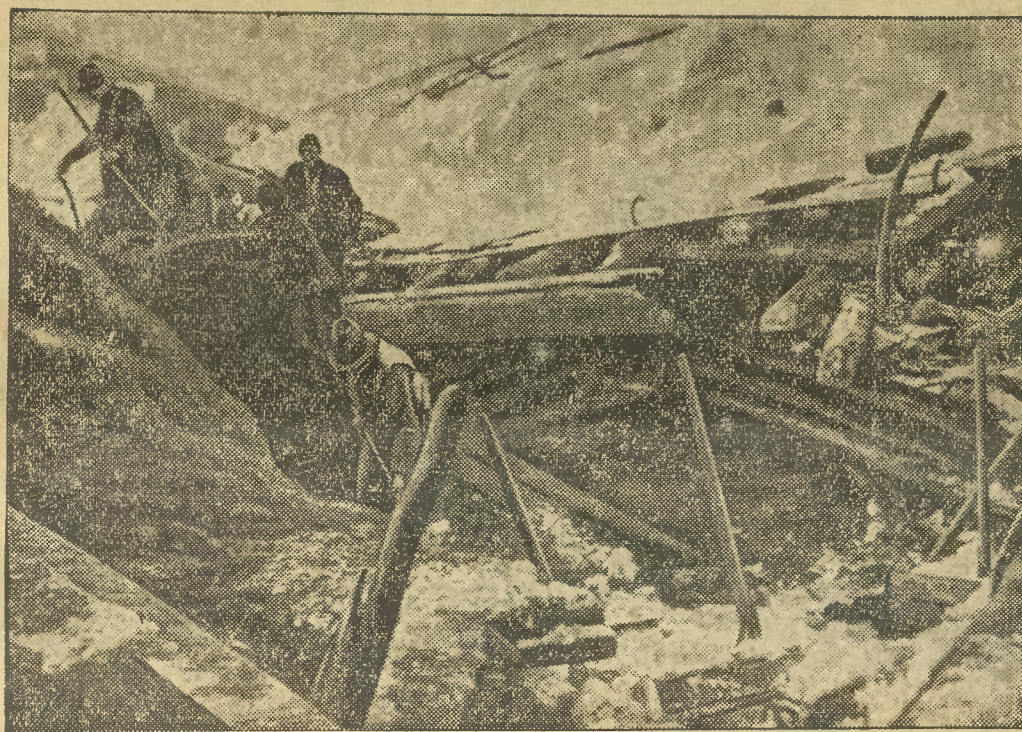
Z wysokości 2400 metrów zwały się masy śniegu i kamieni na dwie chaty góralskie w St. Antonien (kanton szwajcarski Graubünden). Siedmiu ludzi zostało żywcem pogrzebanych.