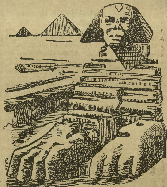
Odgrzebany fundament egipskiego Sfinksa.

Dla ocalenia wielkiego sfinksa w Gizie od ruiny która mu groziła, dokonana została jego kompletna restauracja. Przy tej sposobności odkryto zasypaną dotąd piaskami pustyni doina część pomnika, odsłaniając w ten sposób widoczne na rycinie naszej, a nieznanne dotąd potężne łapy sfinksa.