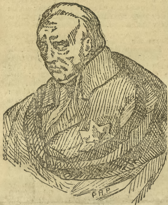
Stanisław Staszic Ur. 1755, zm. 1826