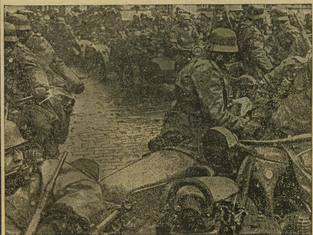
Oddział zmotoryzowanych wojsk niemieckich w pobliżu granicy polskiej.