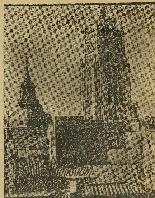
Wieża radiowa w Madrycie.

Londyn, 29. 3. (PAT). Reuter donosi z Madrytu, iż gen. Franco ma przybyć