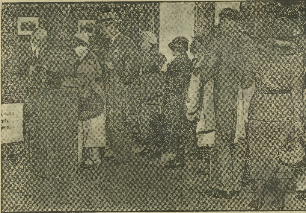
Na stacjach kolejowych w ważniejszych ośrodkach mogli podróżni oddać swoje głosy.