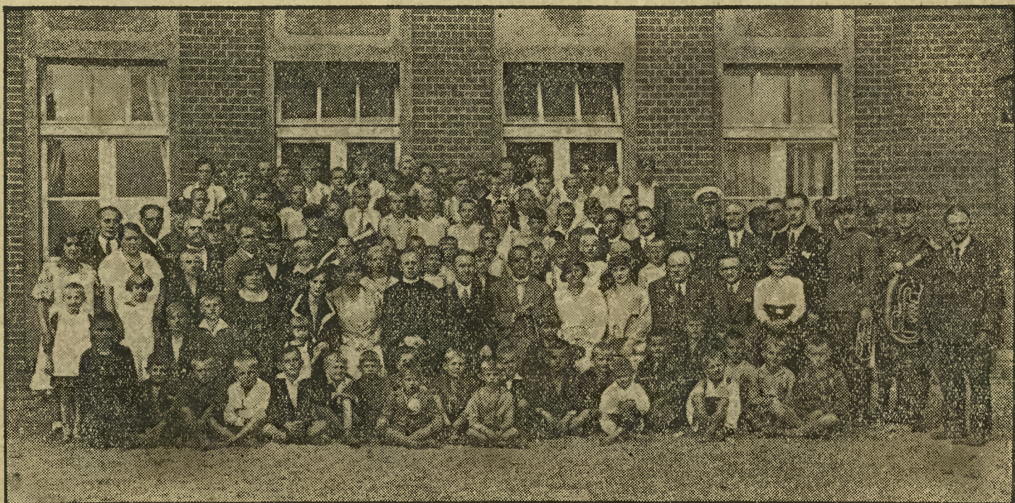
ZAKOŃCZENIE KOLONJI LETNIEJ Z. O. K. Z. W FORDONIE.