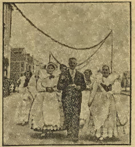
Goście z Śląska Cieszyńskiego.

Nadzwyczajnie barwne wyglądały poszczególne grupy etnograficzne, w przeslicznych strojach ludowych. Szkoda jednak, że w pochodzie nie wzięła udziału obudzająca największą sen-