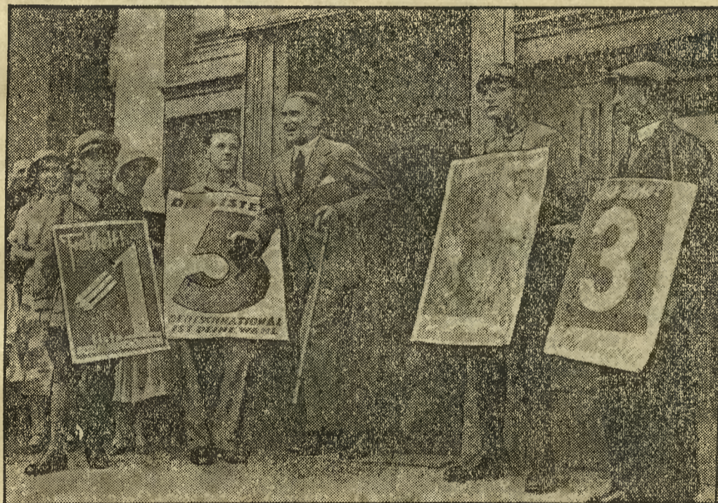
Kanclerz Rzeszy Papen opuszcza jeden z lokali wyborczych w Berlinie.

15 tegich adwokatów i olbrzymiego nakładu środków pieniężnych. A cóż matka pani na to? Przecież ona powinna coś wiedzieć o tej zamianie dzieci.