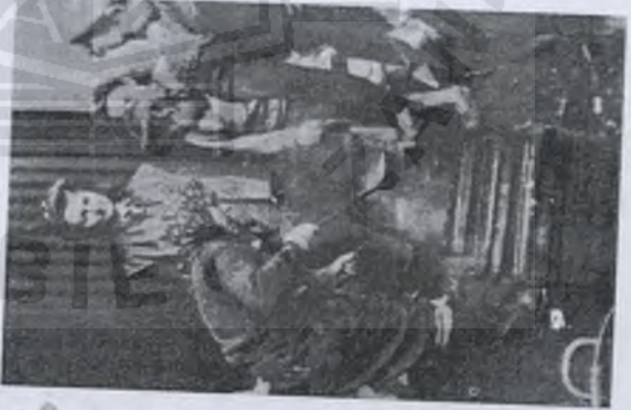
Jedzenie z kotła wszystkim smakuje

NDACJA OKRĘG POMORZE 1939 1945 ACKIE ELN NERAK