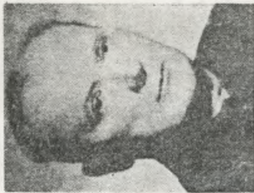
Plk dypl. Kazimierz Pluta-Czachowski „Kuczaba”

Z chwilą zajęcia Pomorza Gdańskiego przez wojska hitlerowskie we wrześniu 1939 r., tworzyły się już w październiku tegoż roku polskie grupy konspiracyjne, które rekrutowały wojskowych różnych stopni. Grupy te powstawały w sposób żywiołowy. Próbowal je ocalić poprzez nadanie im określonego programu politycznego – płk dypl. Kazimierz Pluta-Czachowski, ps. „Kuczaba” (1898–1979). Z tychże grup powstała organizacja o nazwie „Orzeł Biały” (październik 1939 r.). Płk Kazimierz Pluta-Czachowski miał doświadczenie w prowadzeniu tego rodzaju pracy konspiracyjnej. Zdołał być w służbie w szeregach I Brygady Legionów Polskich, a zwłaszcza Polskiej