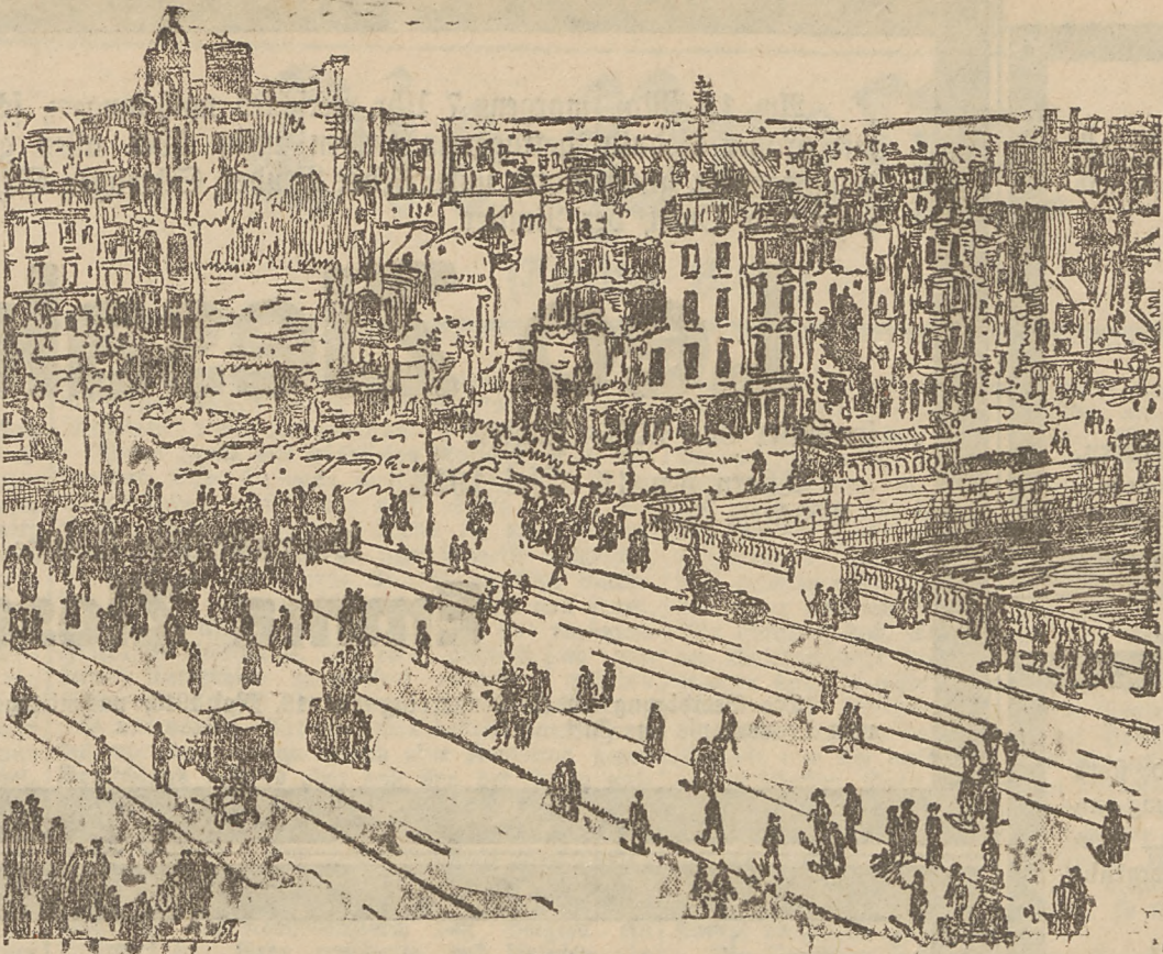
Zu den Umständen in Dublin. Straßenschilder der Stadt nach den Kämpfen.

Die Flachsfaser ist lang und sehr fest; weil sie ziemlich glatt ist, wie man unter dem Mikroskop deutlich erkennen kann, hat auch das aus ihr hergestellte Leinen einen schönen Naturlanz bei beträchtlicher Festigkeit.