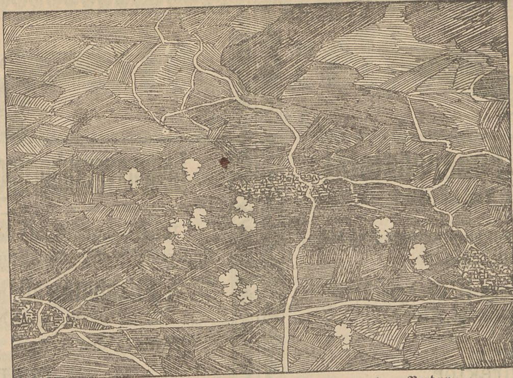
Nächtliche Schrapnellbeschichtung von Flugzeugen vor Verdun.