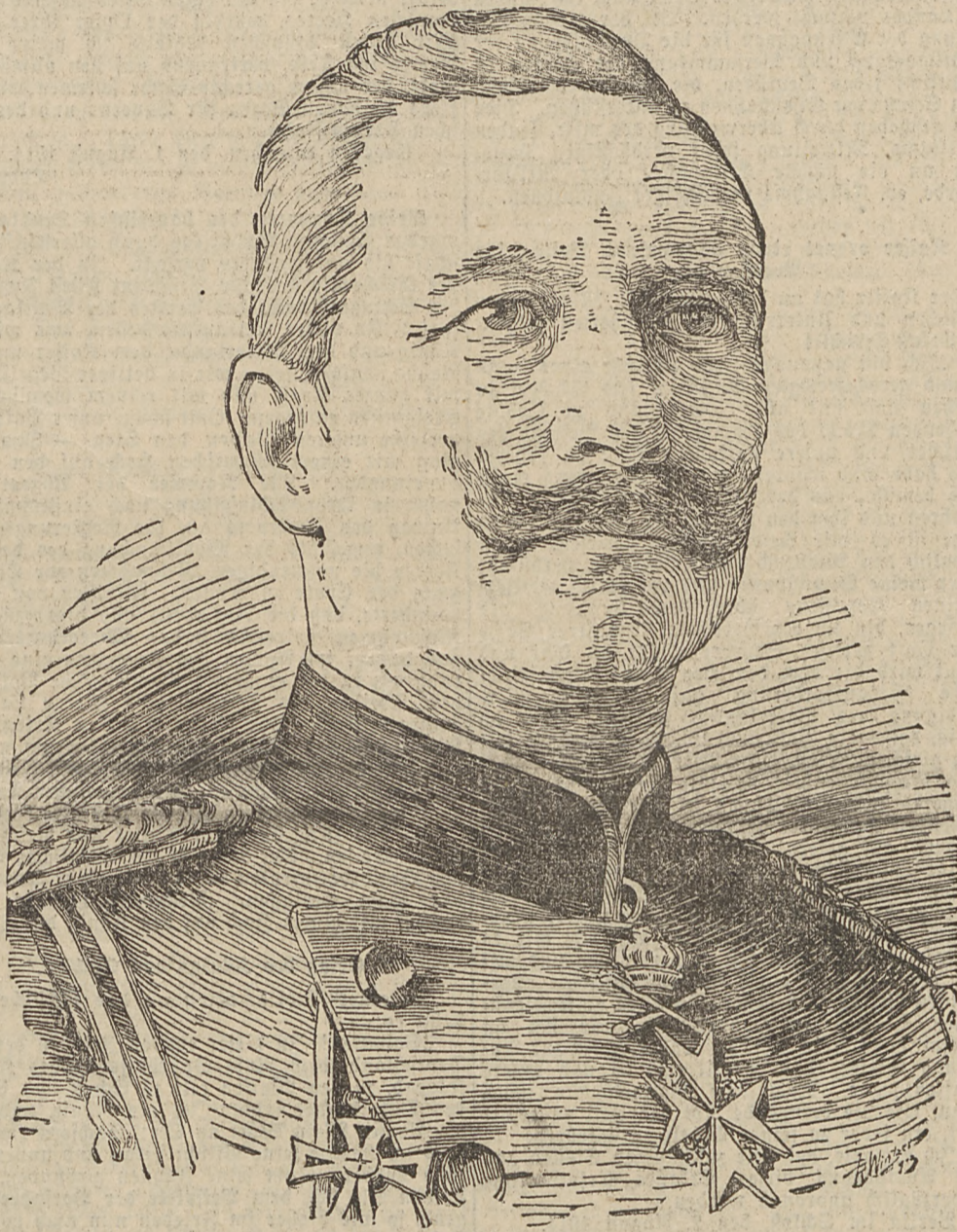
Kaiser Wilhelm II.

Noch bevor der Kriegszustand erklärt worden war, stand im „Vorwärts“ ein Artikel, in dem unumwunden die unbestreitbaren Verdienste Kaiser Wilhelms um den europäischen Frieden, die Redlichkeit seines auf ungehörte Bewahrung der Kulturgüter gerichteten Willens, anerkannt war. Ein gerechtes, wenn auch von dieser Seite ungewohntes Lob. Wenn es noch eines Beweises bedürft hätte, so ist er durch die amtlichen Darlegungen über die Vorgeschichte des gegenwärtigen drohenden Weltbrandes erbracht. In der ganzen gesitteten Menschheit muß die Veröffentlichung des Depeschenwechsels zwischen dem Zaren und dem Kaiser den Eindruck einer unerhörten Arglist machen. Von dem englischen Dichter Rudyard Kipling gibt es ein Gedicht „Warnung vor dem Bären“, das auf die gegenwärtige Situation paßt, als ob es für sie geschrieben