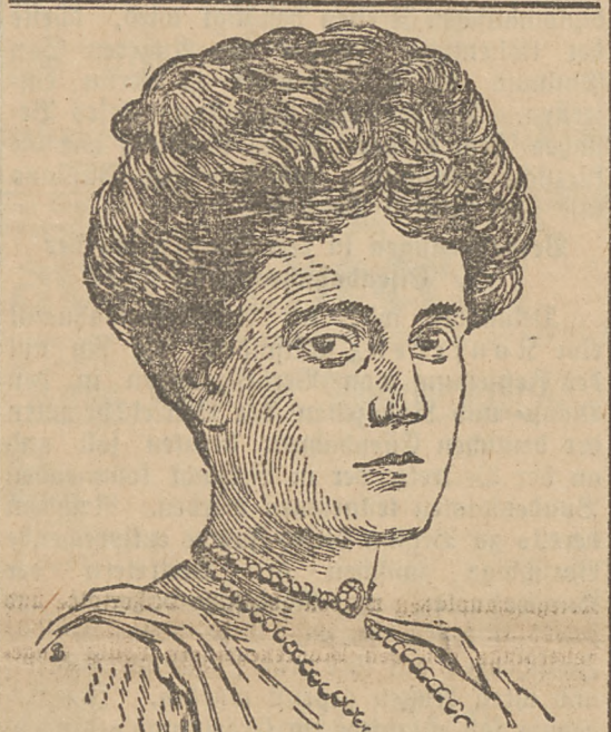
Prinzessin Rupprecht von Bayern f.

— Die bayerische Notenbank hat den Wechselzinsfuß auf 5 Prozent und den Lombardzinsfuß auf 6 Prozent erhöht.