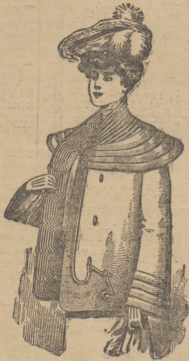
Façon „Giron“. Eleganter Sakko, von schwarzen Rips- stoffen, durchweg gefüttert, jetzt Mk. 10,00.