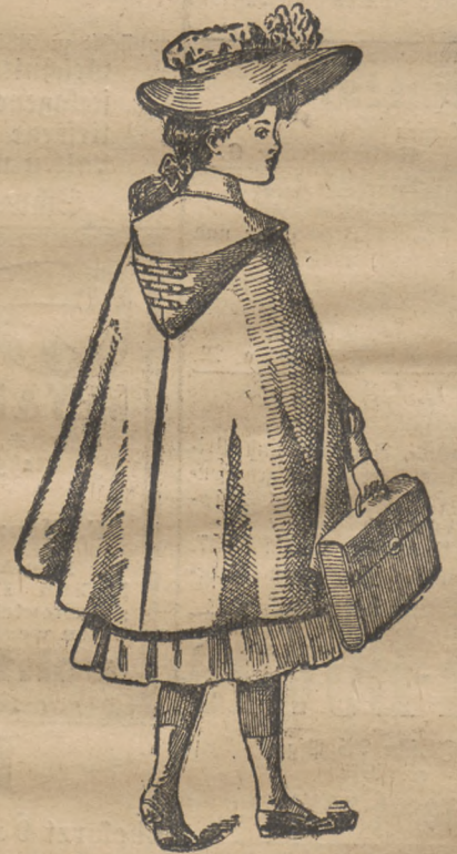
Façon „Lotte“. Beliebtes Backfisch-Cape, in allen Größen vorräthig, jetzt Mk. 4 bis 6.

mit reicher Liberty-Garnirung, von Mk. 5,00 bis 40,00.