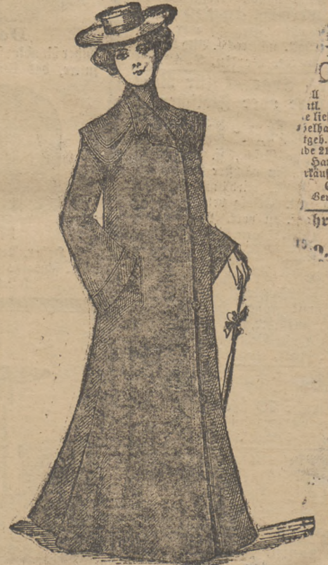
Façon „Sorma“. Eleganter Reise- und Staub-Paletot, jetzt Mk. 12 bis 15.