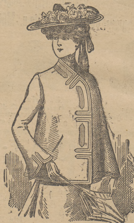
Façon „Roland“. Eleganter Sakko, schwarz und marengé, jetzt Mk. 7,50 bis 9,00.