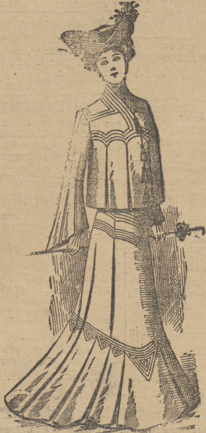
Façon „Monna-Wanna“. Elegantes Faltenbolero-Kostume, von Sakko- und Panama-Stoffen gefertigt, jetzt Mk. 15,00.