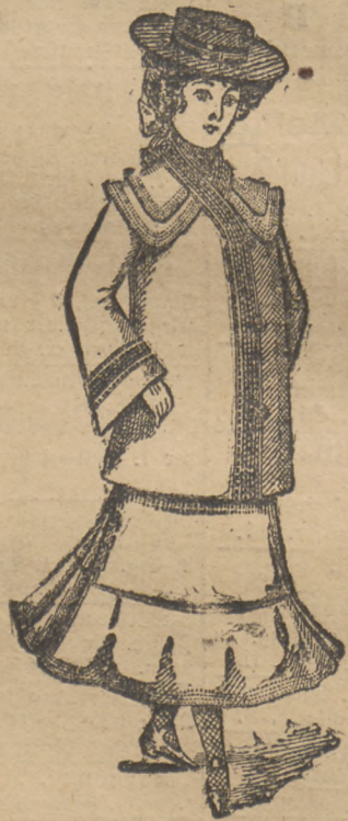
Façon „Elly“. Chiker Backfisch-Paletot in allen Größen, jetzt Mk. 6 bis 10.