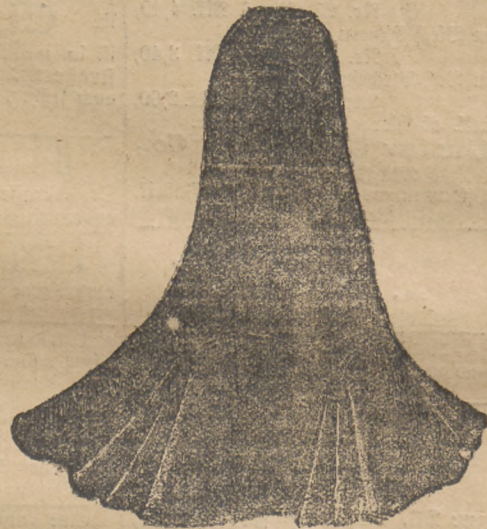
Façon „Trianon“. Eleganter Kostumrock in marengé und schwarz, jetzt Mk. 9 bis 12.

Neu eingetroffen! Wundervolle Auswahl in modernen Stola-Fichus