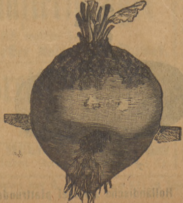
76. Futter-Wrücke grosse weisse pommersche Kannen.