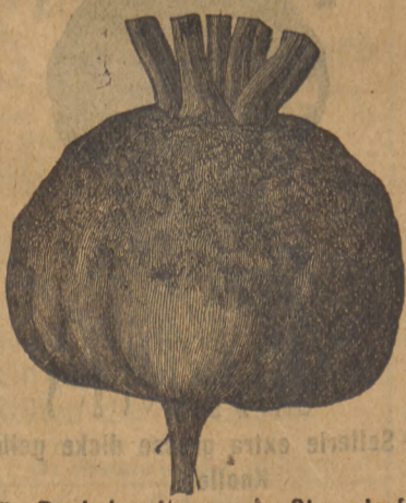
65. Runkel gelbe runde Oberndorfer.