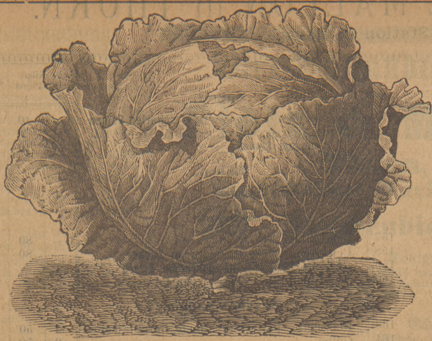
86. Weisses Magdeburger Kopfkohl.