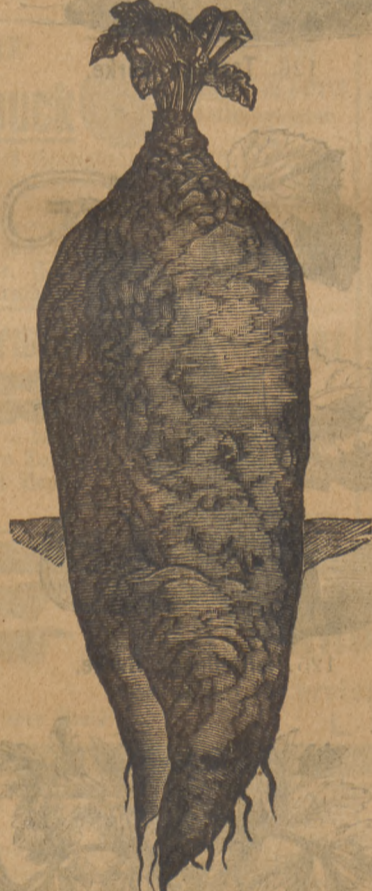
62. Runkel allergrösste rothe Mammoth-Turnips.