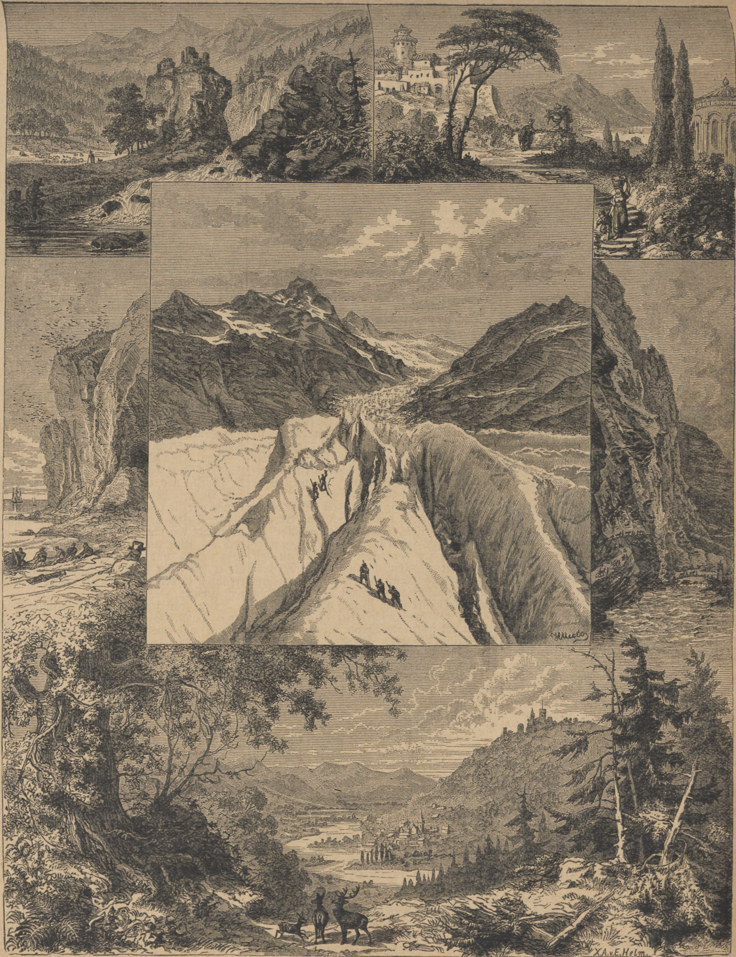
Zonenbilder. (Mit Text auf Seite 72.)