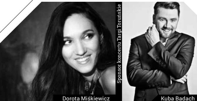
Sponsor koncertu Targi Toruńskie