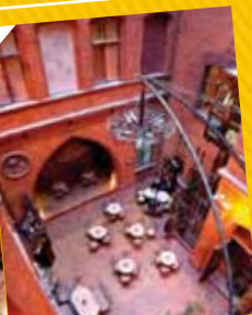
Kafeteria Struna światła